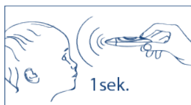
Bezdotykowy pomiar na skroni