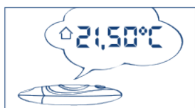
Pomiar temperatury otoczenia