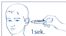
Pomiar temperatury w uchu